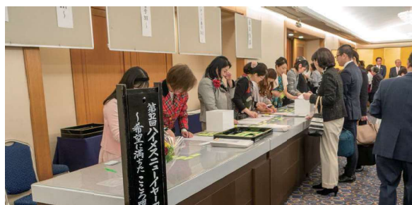
第32回 ニューイヤー委員とアーティスト会員 によるお迎え