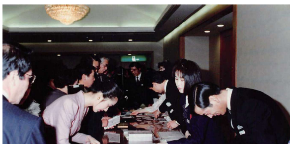
第4回 ホテルの方のご協力の下 お客様をお迎え