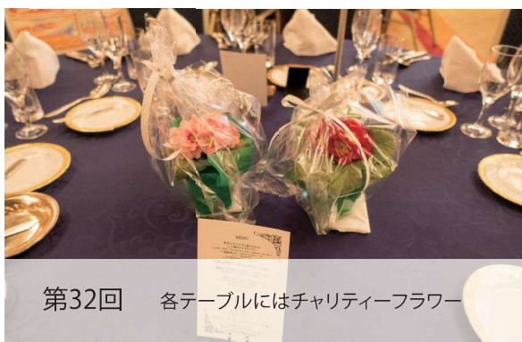
第32回 各テーブルにはチャリティーフラワー