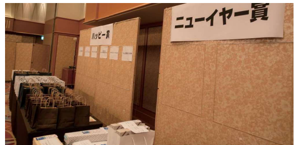
第32回 お楽しみ抽選会の景品