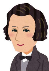
F.ショパン 1810年3月1日生